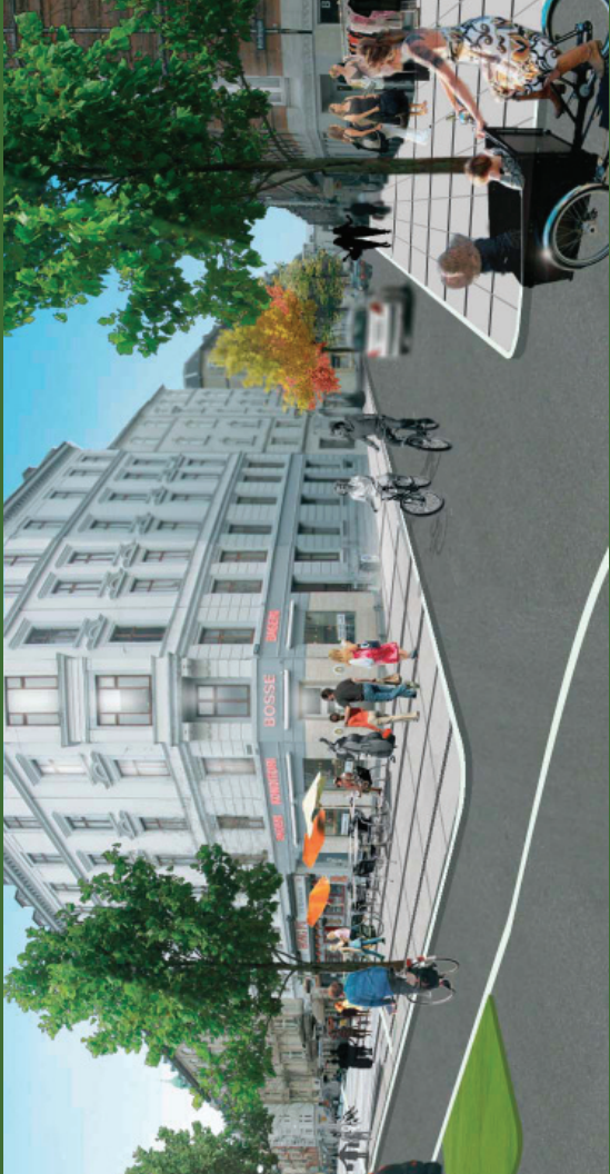
Vision for Østerbrogade ved Arhusgade

Langs den eksisterende kantssten etableres i begge sider parkeringspladser imellem nyplantede træer. Parkeringen foreslås gjort tidsubegrænset. I dag er der parkeringsforbud i den ene side i myldretiden.