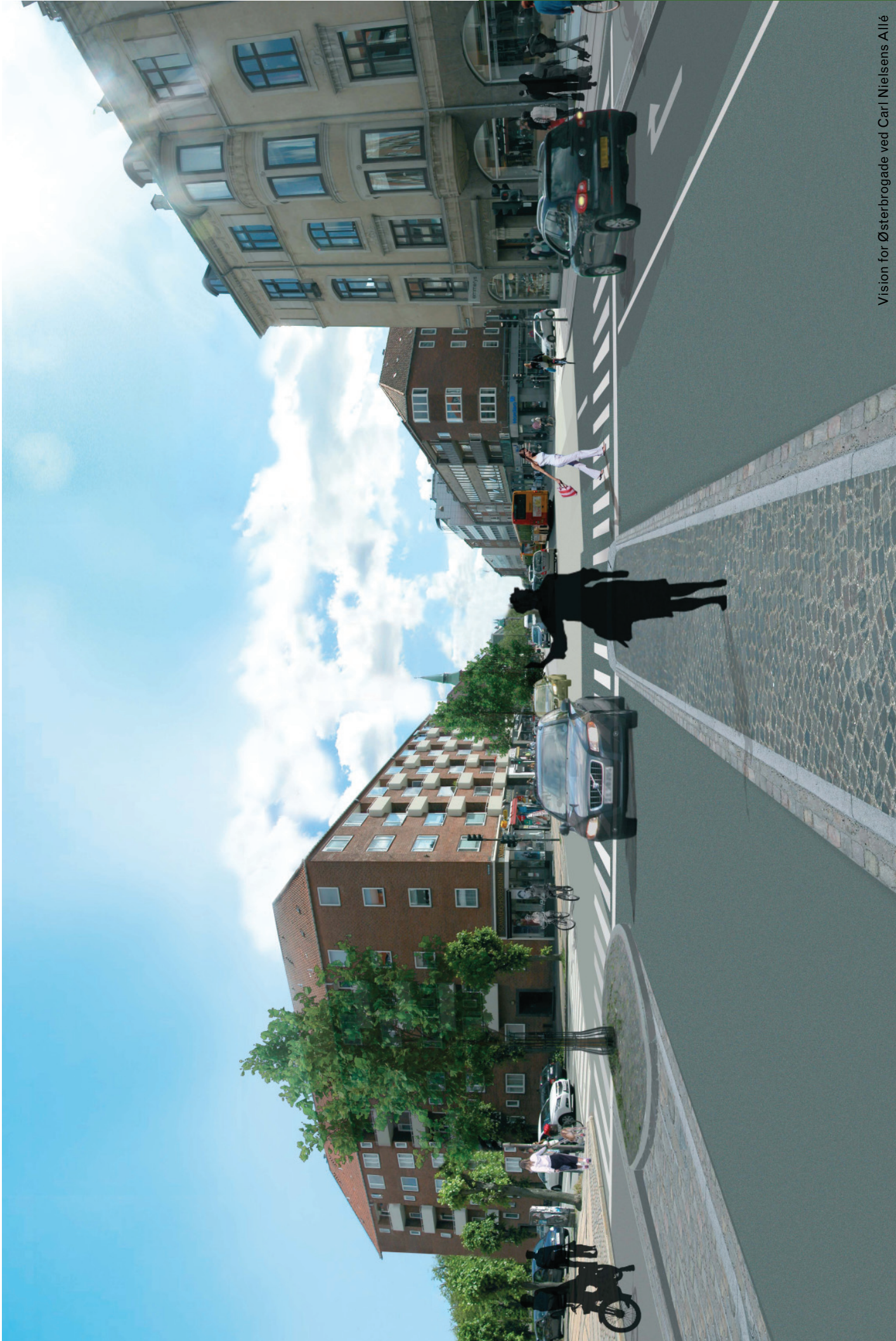
Vision for Østerbrogade ved Carl Nielsens Allé