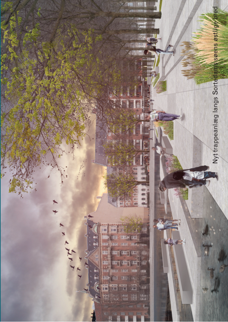
Nyt trappeanlæg langs Sortedams søens østlige bred

Ny plads med pavillon på Lille Trianglen