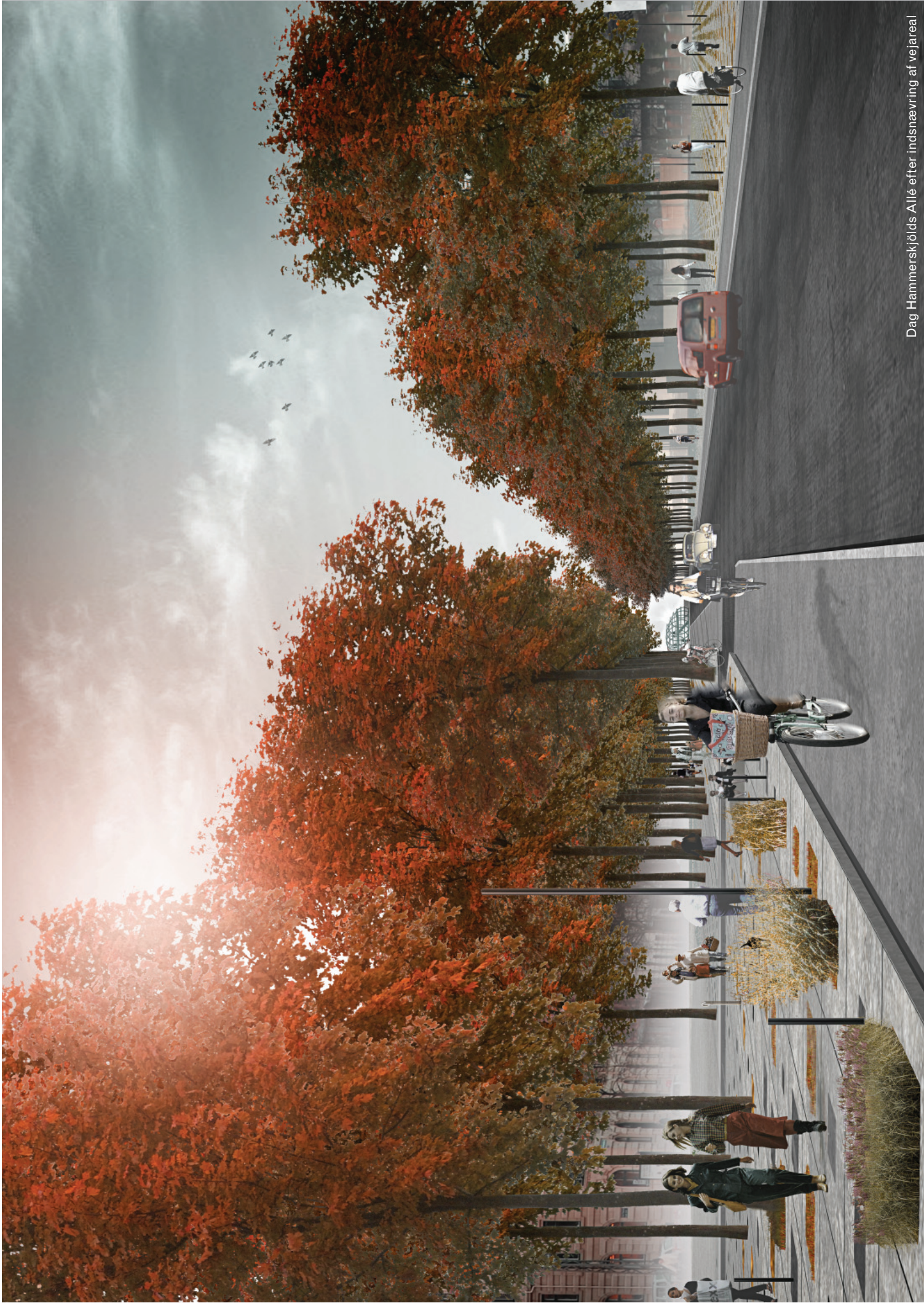
Dag Hammerskjølds Allé efter indsnævring af vejareal